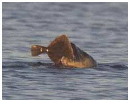
Gräsäl äter flundra.

tok för mycket fisk! Med ett normalt fiskbestånd och ett normalt sälbestånd, skulle sälarnas andel bara vara omkring 1,3 %. Det har vi råd med!