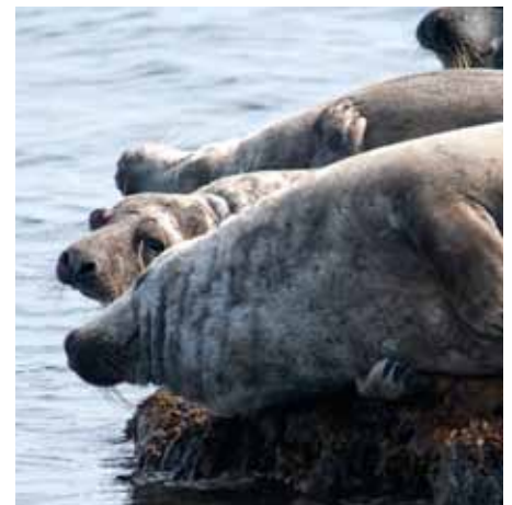
Gräsäl i mitten har ett utslitet högeröga som hänger ut från ögonhålan.