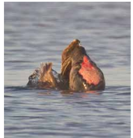
Huden på sälens hjassa är borta. Orsaken är okänd, men det kan ha hänt när den tog sig loss från ett fisknät. En expert misstänker att den är påskjuten med hagel. Sälen har en flundra framför nosen. Till vänster ser man vänster framlabb.