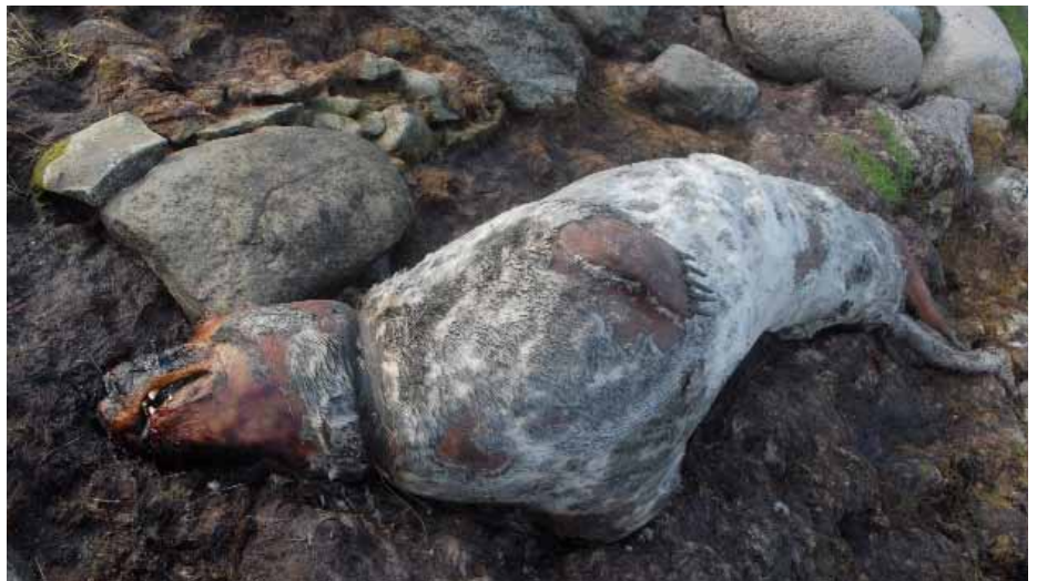
Gräsäl som dött av skadorna från ett fisknät, som fastnat runt halsen, och flutit i land vid Gotlands sydostkust. Sälen på sidan 12 väntar troligen samma öde.

Hur stor andel av fiskbeståndet som sälarna äter beror på hur vi beräknar. En säl äter 6-8 kg fiskkött per dag, mindre under våren. Det betyder att de i dag äter ca 2,7 %